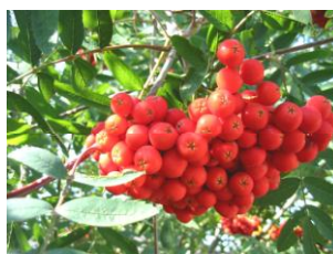
Jarzębina ( sorbus aucuparia )