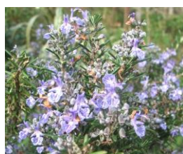
Rozmaryn ( rosmarinus officinalis )