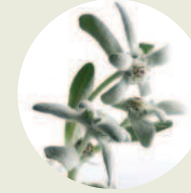
Edelweiss-Eco Leontopodium alpinum