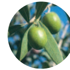
Olivo-Eco Olea europaea