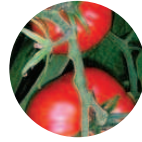
Tomate-Eco Solanum lycopersicum