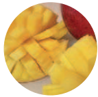
Mango-Eco Mangifera indica