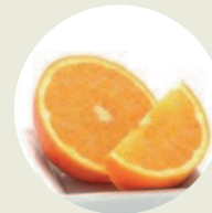
Naranja Waterjuice-Eco Citrus sinensis water