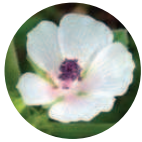
Altea-Eco Althaea officinalis