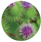
Bardana-Eco Arctium majus