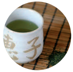
Té verde-Eco Camellia sinensis