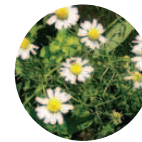
Manzanilla-Eco Chamomilla recutita