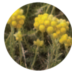
Siempreviva-Eco Helichrysum stoechas