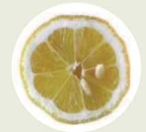
Limón-Eco Citrus limonum