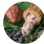
Cacao-Eco Theobroma cacao