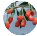
Goji-Eco Lycium barbarum