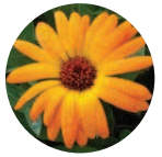
Caléndula-Eco Calendula officinalis