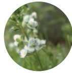
Tomillo-Eco Thymus vulgaris