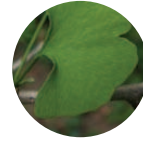
Ginkgo-Eco Ginkgo biloba