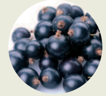
Açaí-Eco Euterpe oleracea