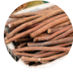
Regaliz-Eco Glycyrrhiza glabra