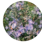
Romero-Eco Rosmarinus officinalis