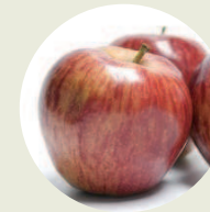
Manzana-Eco Pyrus malus