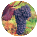
Viña Roja-Eco Vitis vinifera