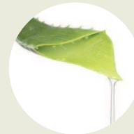
Aloe vera Gel-Eco Aloe barbadensis