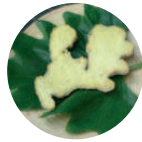
Jengibre-Eco Zingiber officinalis