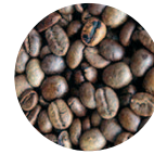
Café-Eco Coffea arabica